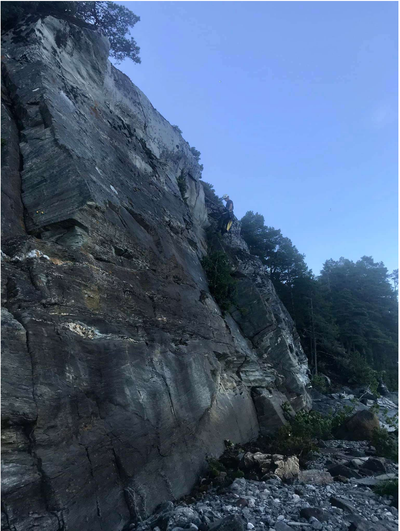
Dugnad på det nye sportklatrefeltet i Paradisbukta. Fjellveggen ligger ved vannkanten i retning mot Skåtangen.